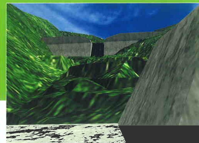
測量でポイントデータを取得して3次元地形データを作成した後、設計図から起こした砂防ダムの3次元ポリゴンモデルを配置し、色付けて仕上げた。約2000枚の静止画を使ってアニメーションも作成している