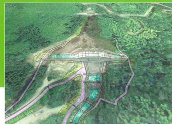
住民説明会用に始めたCAD活用の第一弾。航空写真をベースとして、スケールを調節しながら、CADでつくった砂防ダムの平面図を貼り込んでいる。擬似的な3次元表現だ

出来上がった地形に設計図から起こした砂防ダムの3次元ポリゴンモデルを配置し、色付けて、最終的には上空から鳥の視点でダムを眺めたような動画に仕上げた。「住民説明会には高齢者も大勢参加することに配慮し、ゆったりとした動きになるよう心がけた」と言う。